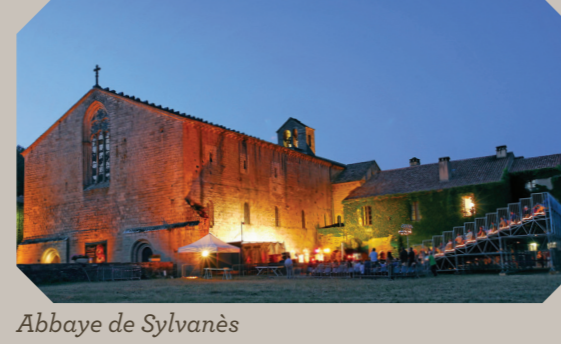
Abbaye de Sylvanès

Onze d'entre eux figurent sur la route des Seigneurs du Rouergue, tous alliés pour vous proposer des visites de qualité ! Les édifices religieux ne sont pas en reste, de l'abbaye cistercienne de Sylvanès au prieuré de Comberoumal. Sur le Larzac et autour, les superbes cités templières et hospitalières, La Couvertoirade, La Cavalerie, Le Viala-du-Pas-de-Jaux, Sainte-Eulalie-de-Cernon et Saint-Jean-d'Alcas, vous ouvrent leurs remparts. Citons encore le site archéologique de La Graufesenque à Millau, les statues-menhirs de la vallée du Rance et du Dourdou (telle la mystérieuse "Dame de Saint-Sernin"), les tombes wisigothes des Costes-Gozon : l'histoire humaine des Grands Causses se lit à même le paysage, gravée dans la pierre.