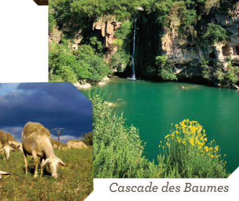
Plateau du Larzac