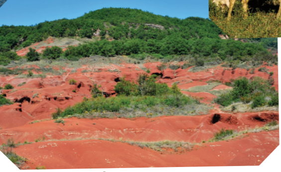
Montagnettes du Rougier

Reliefs calcaires sculptés par l'érosion, les Grands Causses sont de grands espaces humains... et ovins ! C'est l'agropastoralisme, la tradition du pâturage, qui a façonné et préserve encore aujourd'hui les landes et les pelouses sèches, faisant des Grands Causses un paysage exceptionnel à perte de vue.