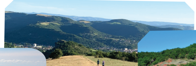
Crête de Tiergues