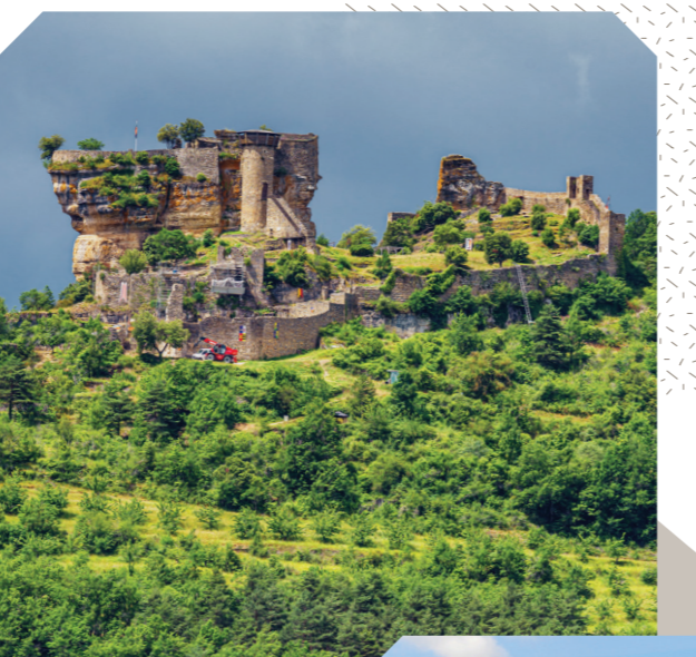
Château de Peyrelade