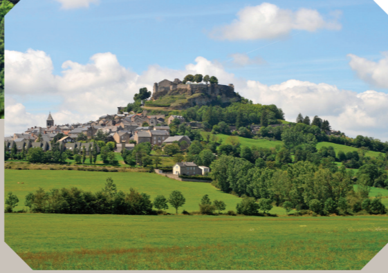
Château de Sévérac